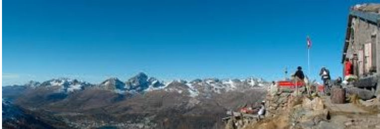
Wanderung Klimaweg - Segantinihütte